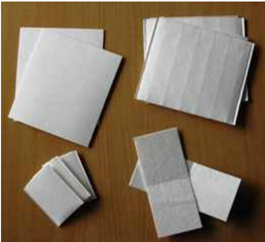
दोपहिया वाहन के लिए पाऊचेबल ग्रेड बैटरी सेपेरेटर

फ्लडेड लीड एसिड बैटरियों के लिए यौगिक बैटरी सेपेरेटर के संशोधित रूप का विकास, निर्माण और परीक्षण किया गया ताकि निर्यात बाजार और उच्च ओ.ई.एम. जरूरतों की पूर्ति की जा सकें। यह उत्पाद पूरी तरह स्वचालित उच्च गति प्लेट इनवेलपिंग मशीन पर चलेगा। इसकी निर्माण प्रक्रिया में कई किस्मों के फाइबर्स, फिलर्स और बाइन्डर्स का प्रयोग किया जा सकेगा ताकि इन्हें होमोजेनस वेब में ब्लेंड किया जा सके और एक समान स्थिरता और उत्पाद प्रदर्शन देते हुए एकरूपता से प्रसारित किया जा सके। रिब्स और अलग विन्यास के साथ सेप पी.जी.टी.एम. बैटरी सेपेरेटर्स में सुधारीकृत गुण जैसे विद्युत - रसायन ऑक्सीकरण के प्रति उच्च प्रतिरोध क्षमता, धुलकर न बहना, बहुत कम विद्युत प्रतिरोधता और अतिरिक्त रूप से तापमान के प्रति उच्च प्रतिरोध क्षमता होंगे जिससे बैटरी का जीवन बढ़ेगा यह सेपेरेटर मौजूदा पॉलीथिलीन (पी.ई.) सेपेरेटर का व्यावहारिक विकल्प होगा। घरेलू तौर पर विकसित ये सेपेरेटर आयातित सेपेरेटर्स की तुलना में सस्ते विकल्प होंगे। इस उत्पाद को अग्रणी बैटरी कंपनियों जैसे एक्सार्ड, अमेरॉन ने परीक्षित एवं प्रमाणित किया है। सफल व्यवसायीकरण के बाद, इस संयंत्र को होलिगसवर्थ एवं वोस कंपनी (एच. एंड वी.), यू.एस.ए. द्वारा नवम्बर 2014 में खरीदा।