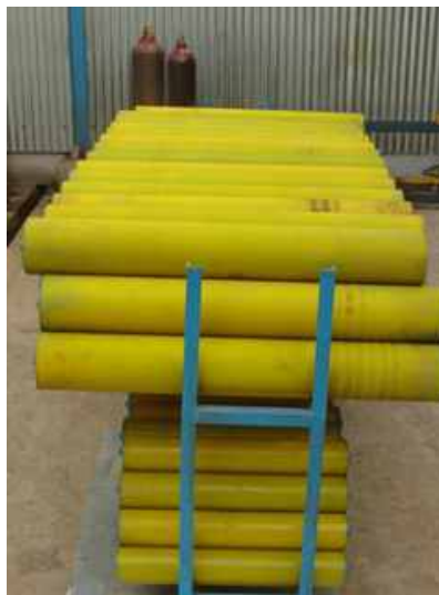
घर्षण हेतु तैयार कन्वेयर सिस्टमों के हाइब्रिड आईडलर्स

नया उत्पाद कन्वेयर बेल्ट सिस्टमों के आईडलर रोलर्स का औसत जीवन बढ़ायेगा जिससे डाउनटाइम से जुड़े रख - रखाव में कमी आयेगी और उत्पादकता में सुधार होगा। यह पेटेंट प्रौद्योगिकी, उच्च एल्यूमिना सिरैमिक पाउडर और पॉलीमर के अनूठे मिश्रण के साथ, विशेष किस्म के पॉलीमर के साथ, कन्वेयर रोलर्स की कोटिंग की प्रक्रिया से जुड़ी है। यह कोटिंग, हाइब्रिड आईडलर रोलर्स को उच्च घर्षण प्रतिरोधकता गुण प्रदान करती है और इसका घर्षण गुणांक बहुत कम है। इससे परंपरागत रोलर्स की तुलना में बिजली की खपत और ऊर्जा की बचत लगभग 12% से 15% तक होती है। टाटा स्टील ने अनेक व्यापक क्षेत्र परीक्षणों के बाद कंपनी को हाइब्रिड रोलर्स के लिए आर्डर किया है। कंपनी ने, घर्षण और जंगरोधकता के क्षेत्रों में नई सामग्री के विकास के लिए, मुम्बई में भारतीय एस.एम.ई. फोरम से वर्ष 2013 - 14 में एस.एम.ई. विशेष (जाइंट) पुरस्कार भी प्राप्त किया है। हाइब्रिड आईडलर प्रौद्योगिकी के प्रोत्साहन को लेकर, उद्योगों के साथ एक जागरूकता बैठक भी 17 अक्टूबर, 2014 को जमशेदपुर में आयोजित की गयी।