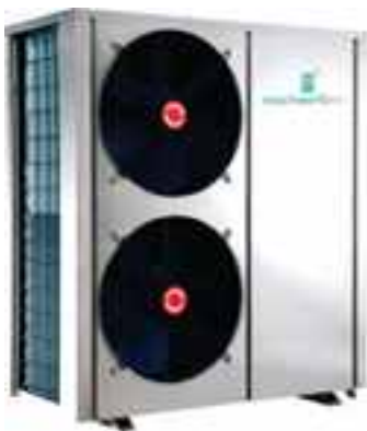
वायु से जल (एयर टू वाटर) हीट पंप

देसी रूप से विकसित बहुपयोगी हीट पंप का विकास जिसमें वायु से जल, जल से जल हीट पंपों और डी. सुपर हीटर शामिल हैं। इसे आई.आई.टी. - बम्बई द्वारा विकसित पेटेंटेड ट्यूब - ट्यूब हीट एक्सचेंजर प्रौद्योगिकी के प्रयोग द्वारा, विभिन्न औद्योगिक अनुप्रयोगों के लिए विकसित किया गया है। हीट एक्सचेंजर का नया डिजाइन, पारंपरिक हीट पंपों की तुलना में पानी गर्म करने में कम समय में ऊष्मन और शीतल सुविधा उपलब्ध करायेगा। इससे कम कीमत पर बेहतर ऊर्जा दक्षता प्राप्त की जा सकेगी। उत्पाद का सफलतापूर्वक निदर्शन किया जा चुका है और इसे विपश्यना साधना केन्द्र, ईगतपुरी, मैकडोनाल्ड स्टोर, इन्फोसिस प्रशिक्षण केन्द्र, मैसूर आदि जैसे विभिन्न स्थानों पर लगाया गया है।