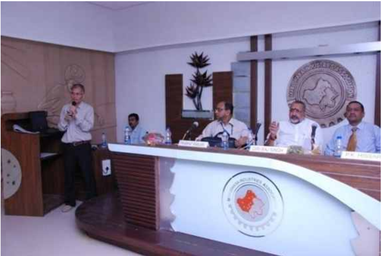
ग्वार गम: 29 मई, 2014 को जोधपुर में विचारोत्तेजक कार्यशाला