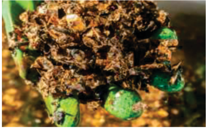
पी.सी.बी.एस. से प्राप्त तांबा