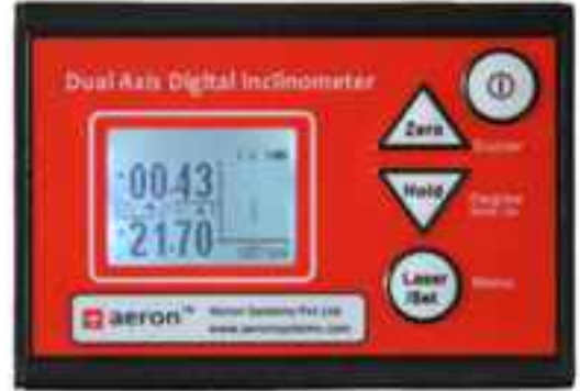
औद्योगिक अनुप्रयोगों एवं अन्य रक्षा युक्त अनुप्रयोगों के लिए डिजिटल इन्क्लिनोमीटर