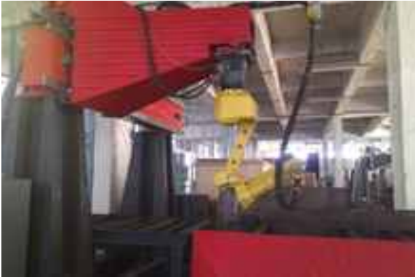
रोबो प्लाज्मा कटिंग मशीन

2-डी और 3 - डी कटिंग के लिए उच्च गुणवत्ता का प्लाज्मा कटिंग सिस्टम जिसके साथ साथ परिशुद्ध रोबोटिक्स और साधारण रूप से एकीकृत तीव्र गति का रोबोरिस्वफ्ट प्रोग्रामिंग सॉफ्टवेयर लगा है, विकसित किया गया है। यह सिस्टम, एक सिस्टम में विभिन्न किस्म के कार्यों को करने की क्षमता उपलब्ध कराता है। इसमें रोबोटिकली नॉन - स्पर्शी (टच) सेंसर लगे हैं। इस मशीन से चारों तरफ से एल - बीमों, वर्गाकार ट्यूबों आदि का विशेष जटिल कटिंग कार्य संभव है। एक रोबोट सभी प्रकार की सामग्री को काट सकता है जबकि मौजूदा मशीनों में ऊपर - नीचे के प्रोफाइलों को काटने में दो रोबोटों का प्रयोग होता है। यह तेज, अधिक स्मार्ट और सस्ता समाधान, उपयोगिताओं को अनूठा लचीलापन देता है ताकि वे ग्राहकों की अनेक जरूरतों को एक साथ पूरा कर सकें।