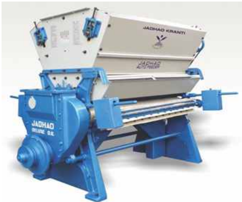
उन्नत ओटाई मशीन क्रान्ति

मौजूदा डबल रोलर ओटाई मशीनों में रोलर्स क्रोमियम चढ़े रद्दी चमड़े से बने होते हैं। ओटाई की क्रिया के दौरान, चमड़े के रोलर लगातार घिसते हैं और कपास के फाहों को प्रदूषित करते हैं। घिसे हुए चमड़े के रोलरों की हफ्ते में एक बार री-ग्रूविंग करानी पड़ती है जिससे मशीनों का डाऊनटाइम बढ़ जाता है। स्वतः खांचेदार रबर रोलर क्रोमियम प्रदूषण की समस्या को खत्म करेंगे और ये कहीं अधिक पर्यावरण और उपयोगकर्ता के अनुकूल होंगे। यह मशीनों के डाऊनटाइम को निश्चित रूप से कम करके उत्पादकता को लगभग 30% तक बढ़ा देंगे। साथ ही ये प्रचालन के दौरान घर्षण में कमी के द्वारा 10 - 15% तक बिजली की खपत भी कम करेंगे। टाइफैक ने सी.आई.आर.सी.ओ.टी. और कंपनी के साथ गिनर्स और गिनिंग मशीन निर्माताओं के साथ, सी.आई.आर. सी.ओ.टी. नागपुर में 25 जुलाई, 2014 को एक प्रौद्योगिकी रोड शो और जागरूकता शिविर का आयोजन किया। एक अग्रणी ओटाई मशीन निर्माता ने भारत में, नये रबर रोलरों के साथ 'क्रान्ति' नामक एक संशोधित डबल रोलर गिनिंग मशीन लांच की है।