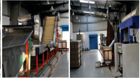
माना मदुराई में मौजूदा सुविधा