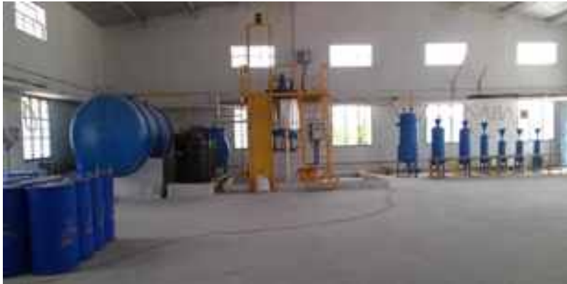
मेसर्स ईकोकेयर, कोयंबटूर में प्रसंस्करण सुविधा

नियंत्रित स्थितियों में उचित प्रक्रिया द्वारा अखाद्य वनस्पति तेलों से व्युत्पन्न जैव - विघटनीय (बायाडिग्रेडेबल) विलयशील कटिंग / क्लैट तेल के अनूठे पेटेंटेड उत्पादन के निर्माण को प्रोत्साहित करना । यह उन पारंपरिक धातु कटिंग तेल का शुद्ध एवं पर्यावरण - अनुकूल विकल्प है जो खनिज तेलों से बनाये जाते हैं और प्रयोग के बाद अलग करने पर पर्यावरण को प्रदूषित करते हैं । इस उत्पाद के अनेक बैच बनाए जा चुके हैं और वास्तविक धातु कटिंग उद्योगों में इनके व्यवस्थित परीक्षण किये गये हैं ।