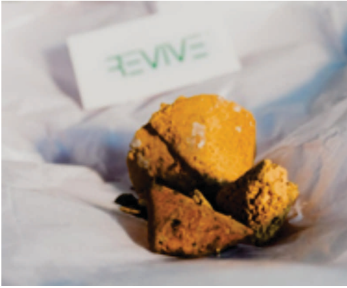
पी.सी.बी.एस. से प्राप्त सोना

पायरोलाइसिस संयंत्र उपलब्ध करायेगा । पायरोलाइसिस प्रक्रिया से प्राप्त हाइड्रोकार्बन तेल का उपयोग भट्ठी तेल के साथ किया जायेगा ताकि ऊर्जा की बचत हो सके । इस प्रक्रिया से प्राप्त धातु पिंड को कीमती धातुओं जैसे सोना, तांबा, चादी आदि की प्राप्ति भी होगी ।