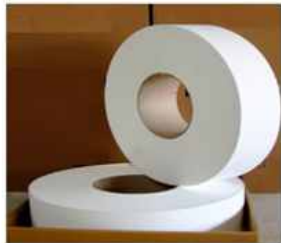
रिब्स के साथ रोल्स में पाऊचेबल ग्रेड बैटरी सेपेरेटर