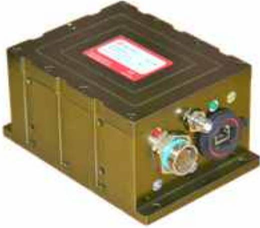
यू.ए.वी. हेतु जी.पी.एस. इनर्शियल नेवीगेशन सेंसर