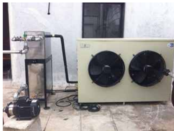
स्थापित अवशिष्ट ऊष्मा प्राप्ति तंत्र